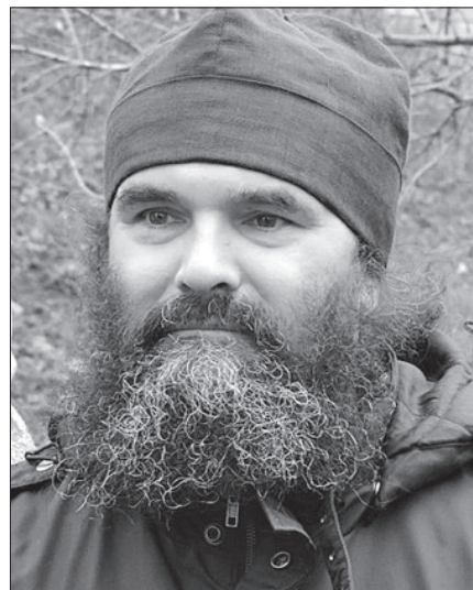
нию Поморского края, укреплению северян в вере Православной.