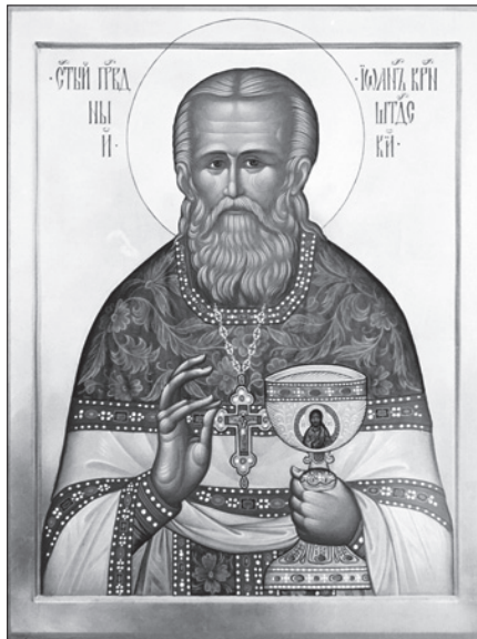
Св. прав. Иоанн Кронштадтский. Сийская иконописная мастерская.

14 июня — Неделя 2-я по Пятидесятнице, Всех святых, в земле Русской просиявших. Прав. Иоанна Кронштадтского (прославление 1990 г.). Всех преподобных и богоносных отцов, во Святой Горе Афонской просиявших.