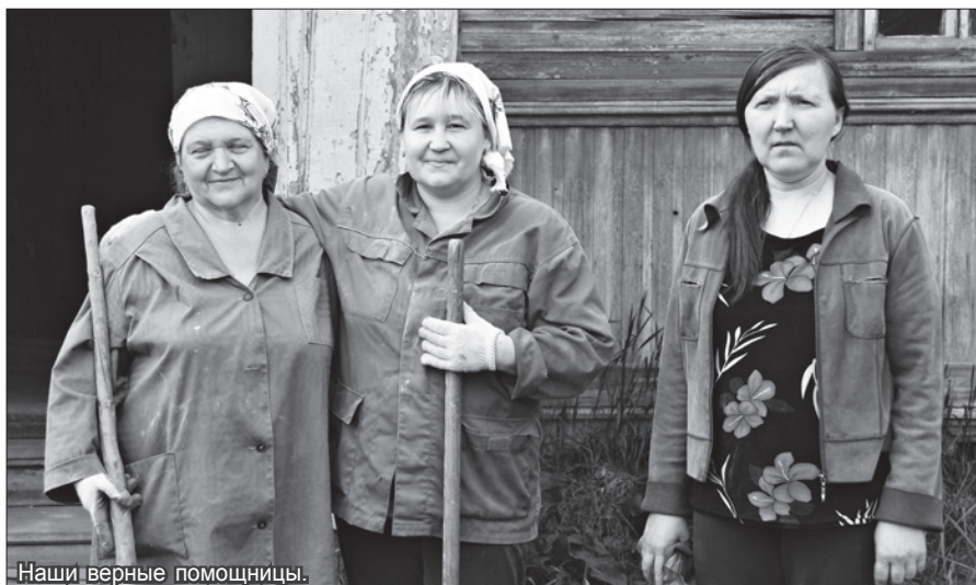
Наши верные помощницы.

8 июня началось восстановление храма. На первом этапе строителям